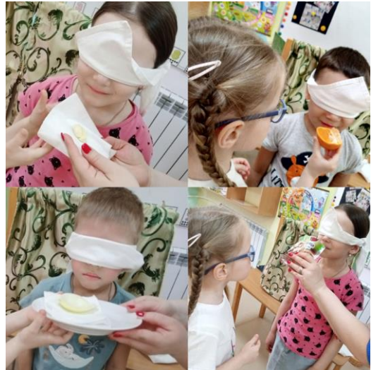
Отгадай по запаху