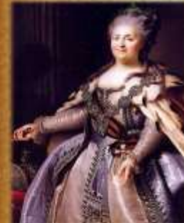
Екатерина II русская императрица (1762 – 1796)

Русский народ есть особенный народ в свете, который отличается догадкой, умом, силою.