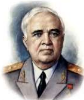
Композитор Александр Васильевич Александров

Утверждён 25 декабря 2000 (музыка) 30 декабря 2000 (слова)