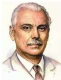
Автор слов Сергей Владимирович Михалков