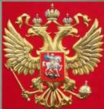
Новый герб Российской Федерации утвержден 30 ноября 1993 года.