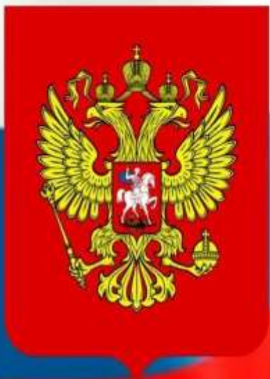
Герб Российской Федерации

В 2000 году был принят новый закон «О Государственном Гербе Российской Федерации», устанавливающий описание и порядок использования герба.