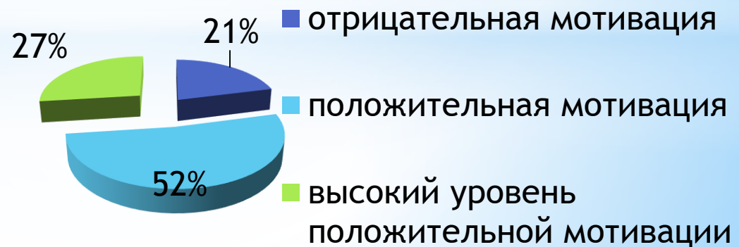
результаты диагностики развития уровня мотивации обучения в школе